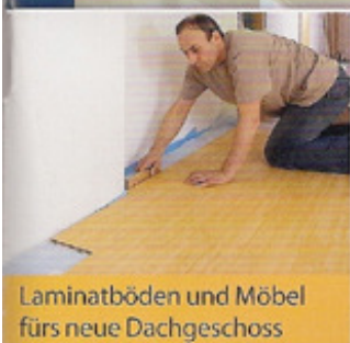
Laminatböden und Möbel fürs neue Dachgeschoss