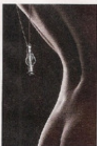
*Meine Drücke auf www.ta.co

Ihnen fehlt die Motivation, Ihnen fehlen die Ideen, Ihnen fehlt das Know-how? Dafür gibt es ja uns. Bauen & Renovieren steht Ihnen auch 2010 mit Rat und Tat zur Seite: Mit guten Ideen, mit interessanten Themen, mit ausführlichen Dokumentationen, mit hilfreichen Tipps und Informationen. Sie sehen, wir sorgen für gute Stimmung, für positive Perspektiven – und machen hoffentlich Lust auf mehr.