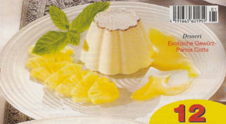
Dessert Exotische Gewürz- Panna Cotta

Kochschule Schritt für Schritt erklärt: Pastete, Putenrollbraten & Aprikosen-Brûlée S. 34-37