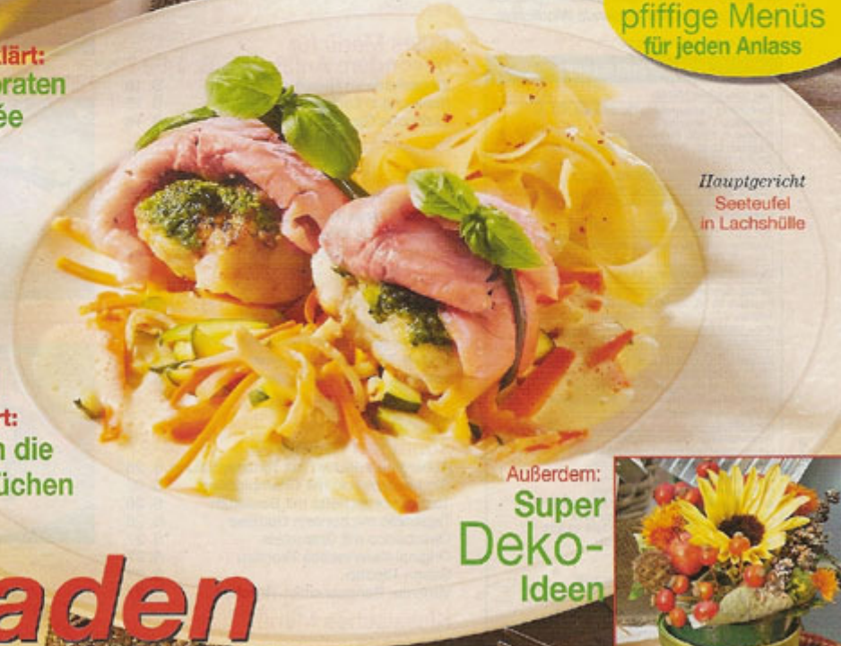
Hauptgericht Seeteufel in Lachshülle

Landhaus-Menü Rustikaler Genuss: Für einen Abend mit Freunden S. 38-41